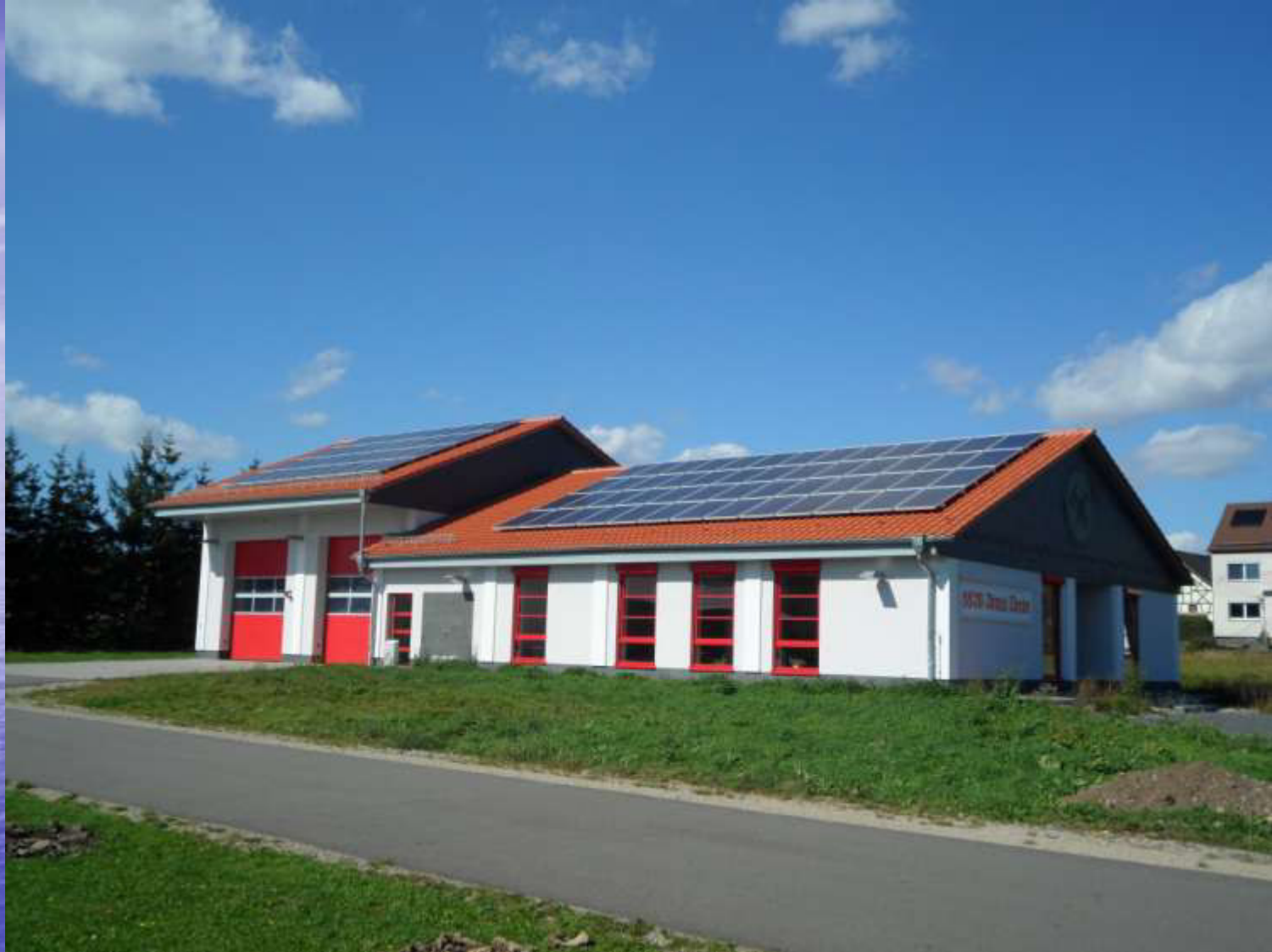
2009 Errichtung einer Photovoltaikanlage - FFW- Gerätehaus Großliebringen