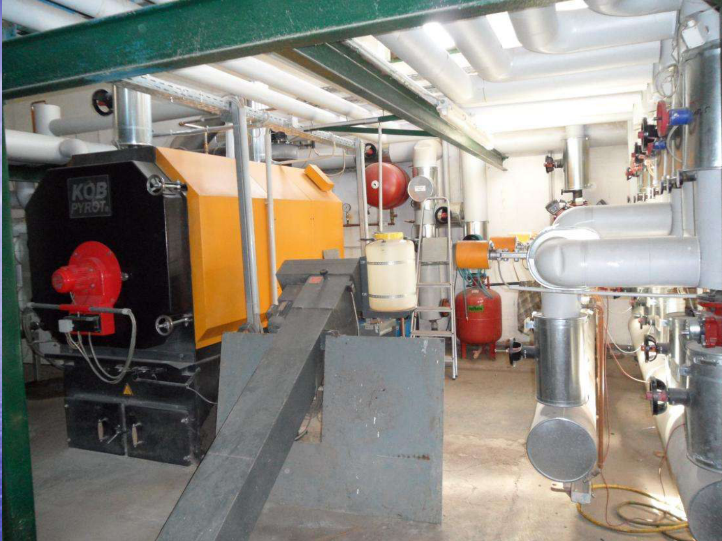
Hackschnitzelheizung Dörnfeld – Heizkessel, Leistung 220kW